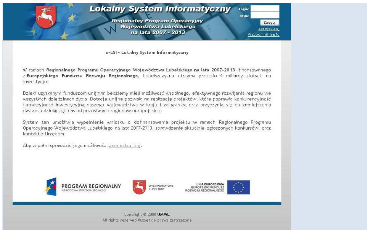
Rys 1. Wygląd strony http://elsi.lubelskie.pl .

Po kliknięciu na link z napisem „Zarejestruj” pokaże się formularz rejestracji Wnioskodawcy (Rys 2.). Pola oznaczone „*” są wymagane do rejestracji Wnioskodawcy. W przypadku braku faxu, Wnioskodawcy mogą wpisać w pole „Fax” słowo „brak” dla potrzeby poprawnego przejścia rejestracji. Po wypełnieniu poprawnie formularza należy kliknąć przycisk „Zarejestruj”. Na podany adres mailowy osoby zgłaszającej zostanie wysłany numer ID, który umożliwi logowanie się w systemie w przypadku utraty hasła.