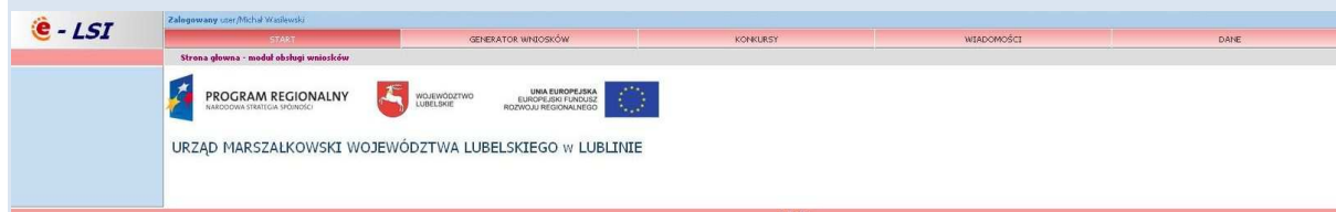
Rys. 4. Wygląd systemu e-LSI po zalogowaniu.

Po poprawnym zalogowaniu się do systemu na górze ekranu pojawia się pasek menu z zakładkami „START” „GENERATOR WNIOSKÓW”, „KONKURSY”, „WIADOMOŚCI”, „DANE”, „WYLOGUJ SIĘ” (Rys. 4).